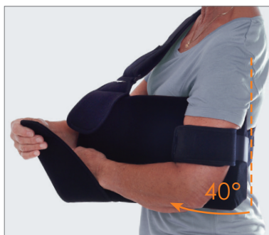
Elevation 40 grader.