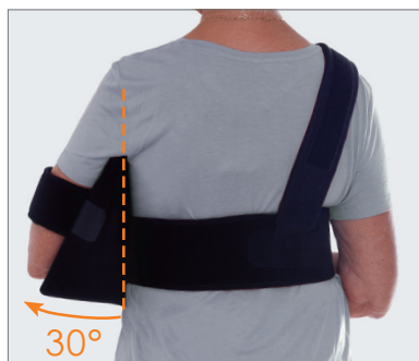
Abduktion 30 grader.