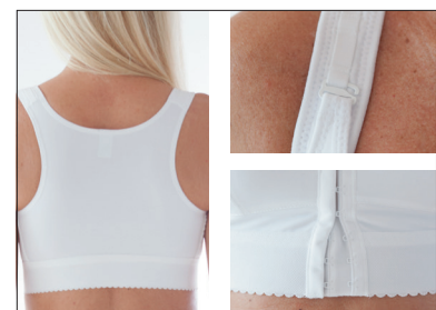
Brottarrygg. Justerbar framtill och i axelband.