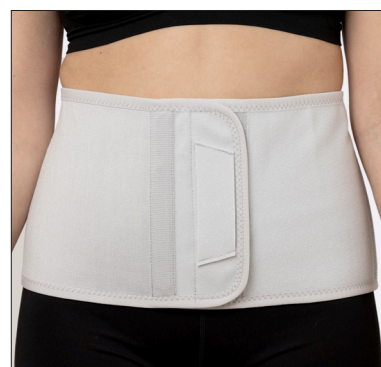
50212: 20 cm