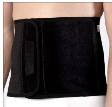
50210: 25 cm