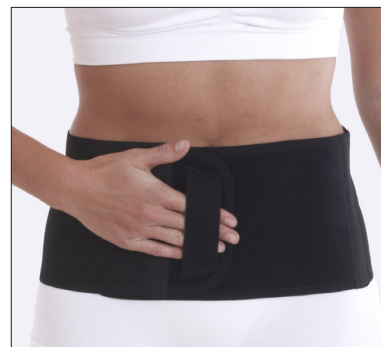
50211: 16 cm