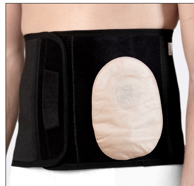
50210: 25 cm