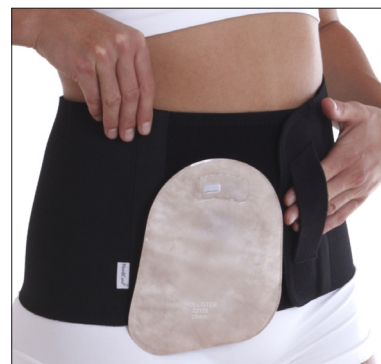
50212: 20 cm