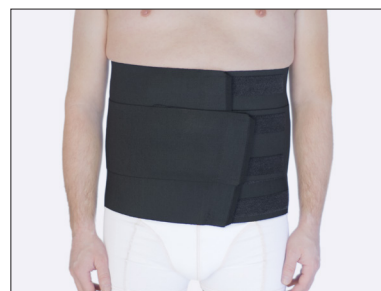
ViraKing - endast i svart, storlek 2-3XL.