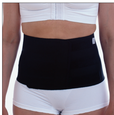
ViraRak 20 cm, 50231