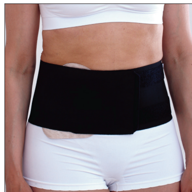
ViraRak 15 cm, 50230