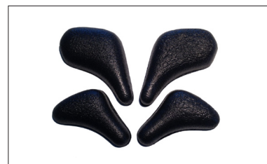
50257-00-50 Pads, Medium, 50257-00-60 Pads, Large