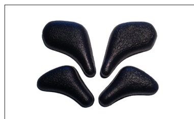
50257-00-50 Pads, Medium, 50257-00-60 Pads, Large