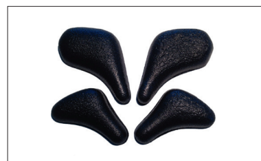
Art.no 50257-00-50 Medium, Art.no 50257-00-60 Large