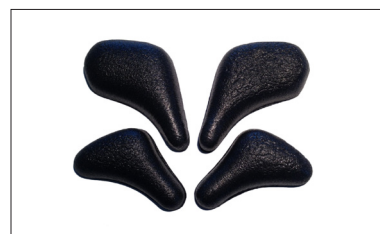
50257-00-50 Pads, Medium 50257-00-60 Pads, Large