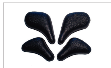
Art.no 50257-00-50 Medium, Art.no 50257-00-60 Large