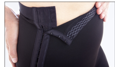
Hysk- och haköppning i båda sidorna samt silikon i linningen.