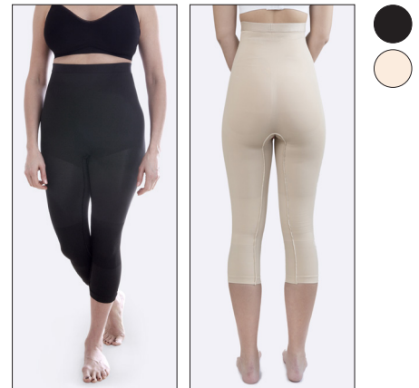
Silikon i linningen.