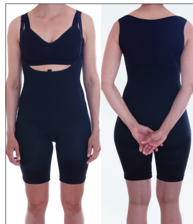
Hysk- och haköppning i båda sidorna samt brett skuren i ryggen.