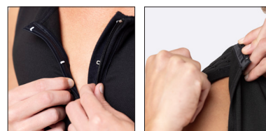
Justerbara axelband. Blixflås med hysk och hak.