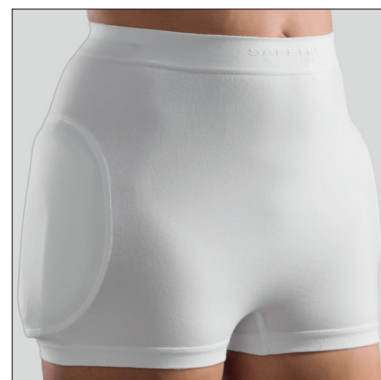
60310: Safehip AirX Unisex