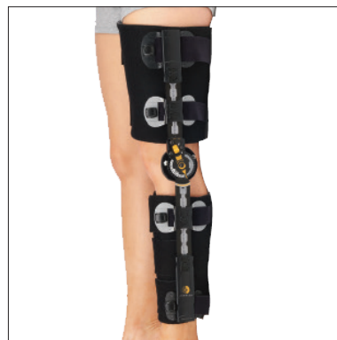
Contender Full Foam