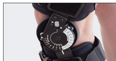
Extension och Flexion kan justeras och låsas från 0° till 45° i intervaller om 10°/15°. Kontrollerat rörelseomfång mellan 0° till 120° bestäms enkelt med tryckknapp i intervall om 10°/15°.