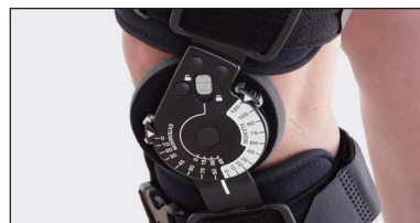
Extension och Flexion kan justeras och låsas från 0° till 45° i intervaller om 10°/15°. Kontrollerat rörelseomfång mellan 0° till 120° bestäms enkelt med tryckknapp i intervall om 10°/15°.