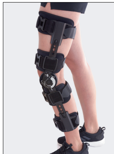
Med teleskopmekanismen kan ortosens längd justeras, från 48 cm till 63,5 cm.