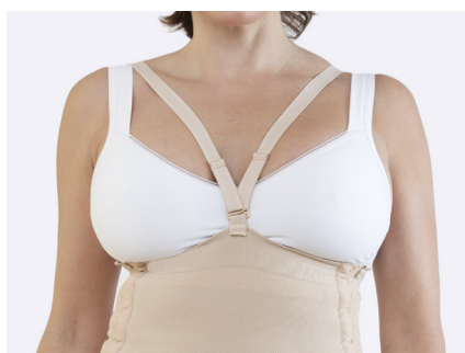
De justerbara axelbanden kan fästas mitt fram eller i sidorna. De kan även tas av helt.