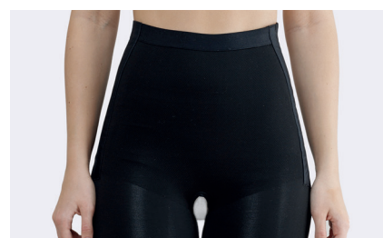
Stickningen är förstärkt över buken.