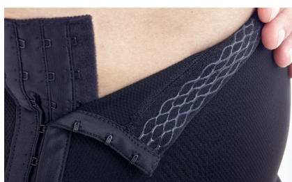
Silikon håller byxan på plats och knäpningen i 3 steg underlättar applicering.