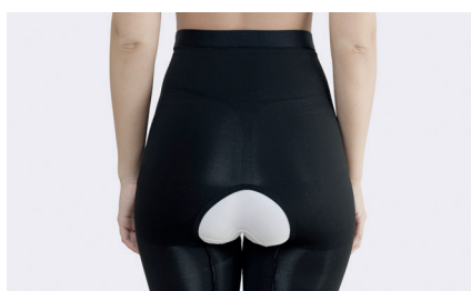
Med den öppna grenen kan byxorna sitta på vid toalettbesök.