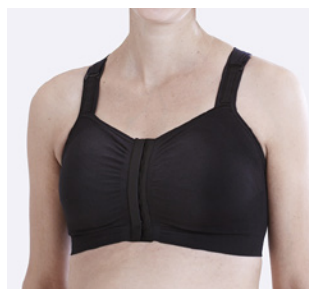
Breda och reglerbara axelband som justeras framtill. Mirabelle finns i vit och svart.