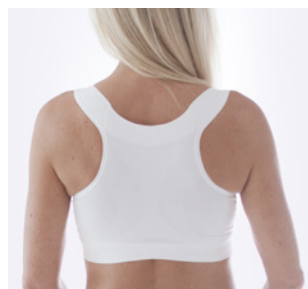
Brottröyg och breda sidor. Mjuk bred sömlös kant under bysten mot eventuella snitt.