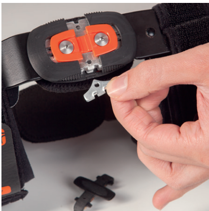
Platt polycentrisk led med plug-in-stopp för begränsning av flexion och extension.