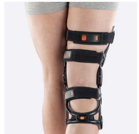
Banden är numrerade, justerbara och väldigt behagliga mot huden.