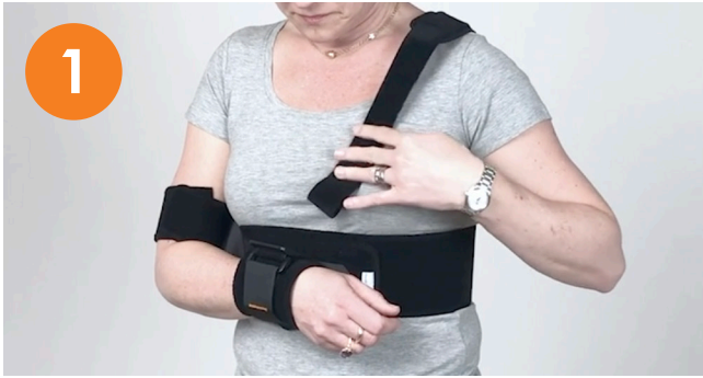
Lossa axelbandet och fäst kardborren.