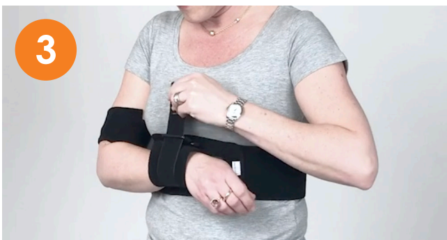
Fäst handledsbandet i undre D-ringen.