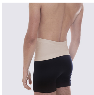
Smalare form i ryggen