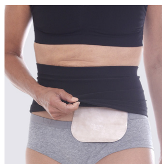
Sitter bekvämt både under och över underkläder