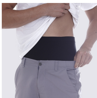
Diskret under kläderna