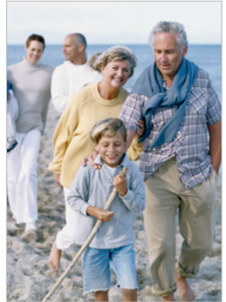
Män och kvinnor i alla åldrar kan använda Ballerina.

Prata gärna med en sjukgymnast för att få tips på rätt träning för just dig.