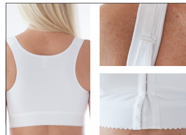
Brottarrygg. Justerbar framtill och i axelband.